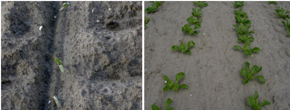
Twee echte blaadjes - 3 weken - 6 – 8 blad stadium

De overgrote meerderheid zal zich wenden tot de oude vertrouwde werking van de BOGT-combinatie of de kant-en-klaar formulering Betanal Expert om de bieten in een tijdstraject van ca. 4 - 5 weken schoon te spuiten.